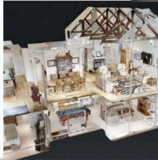
Matterport (real estate 3D scans)